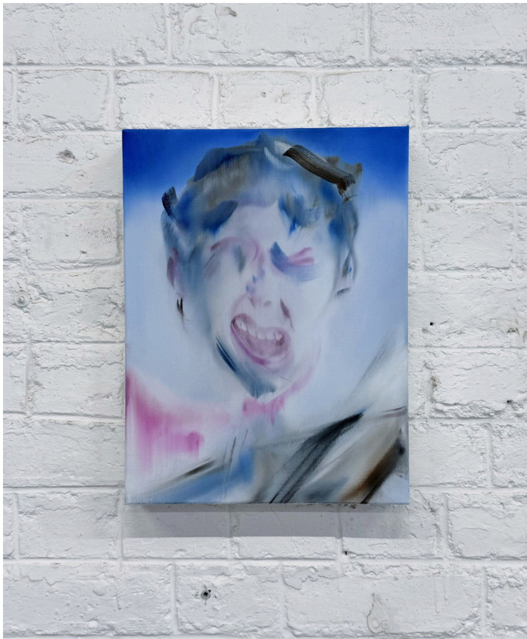
La promesse de l'aube (série) huile sur toile 30 x 40 cm, 2025