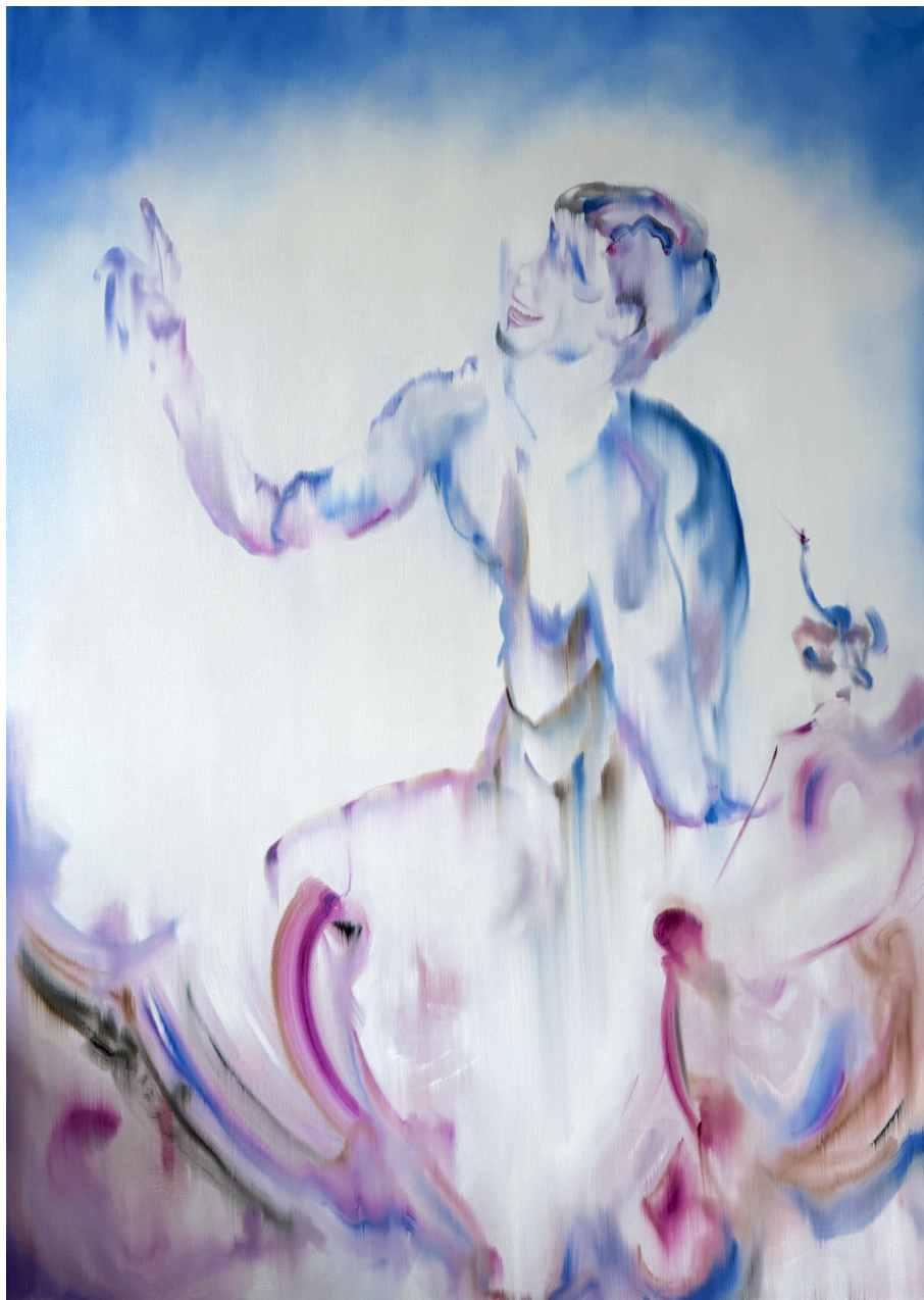
Le railleur (Brûlure) huile sur toile 160 x 115 cm, 2026