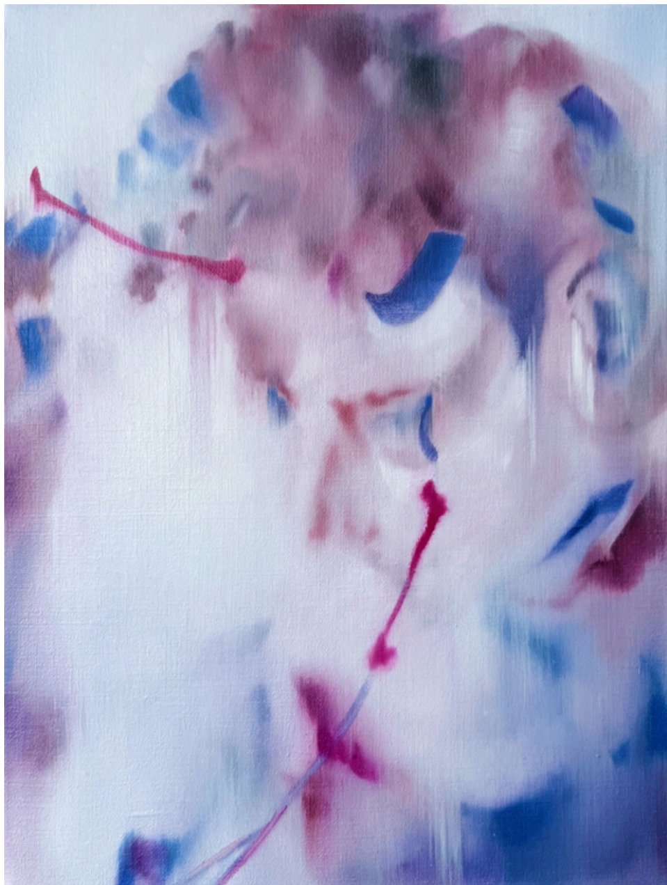
Les pleurs (série) huile sur toile 30 x 40 cm, 2025