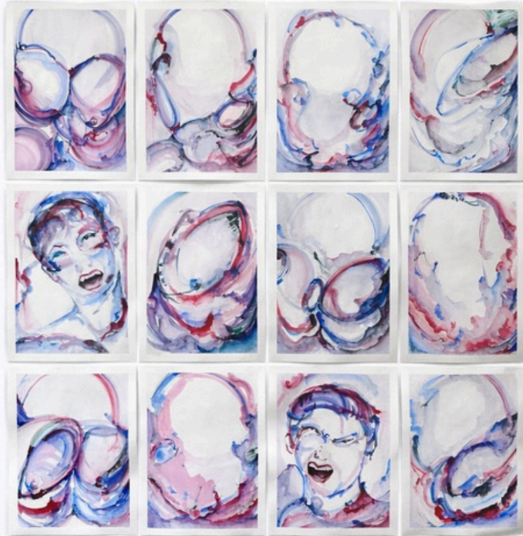
Génération 26 (série) 12 aquarelles sur papier 30 x 40 cm, 2026