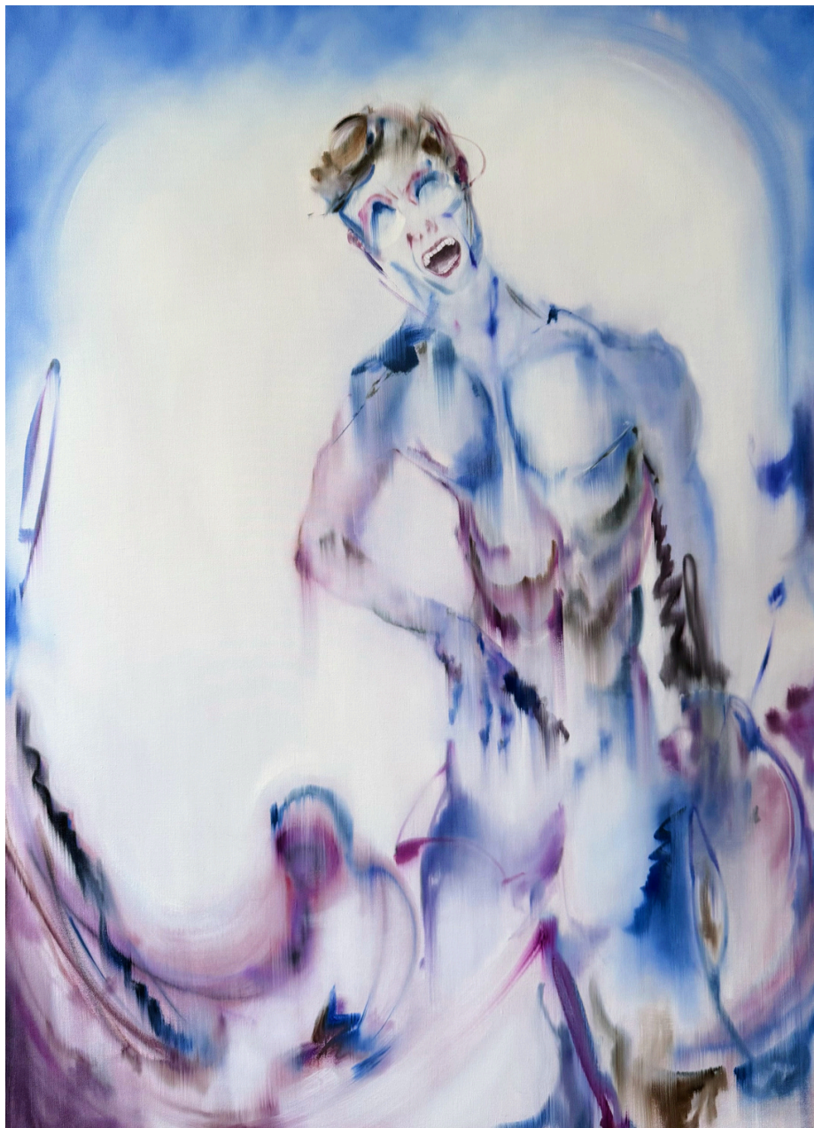
Brûlure huile sur toile 160 x 115 cm, 2026