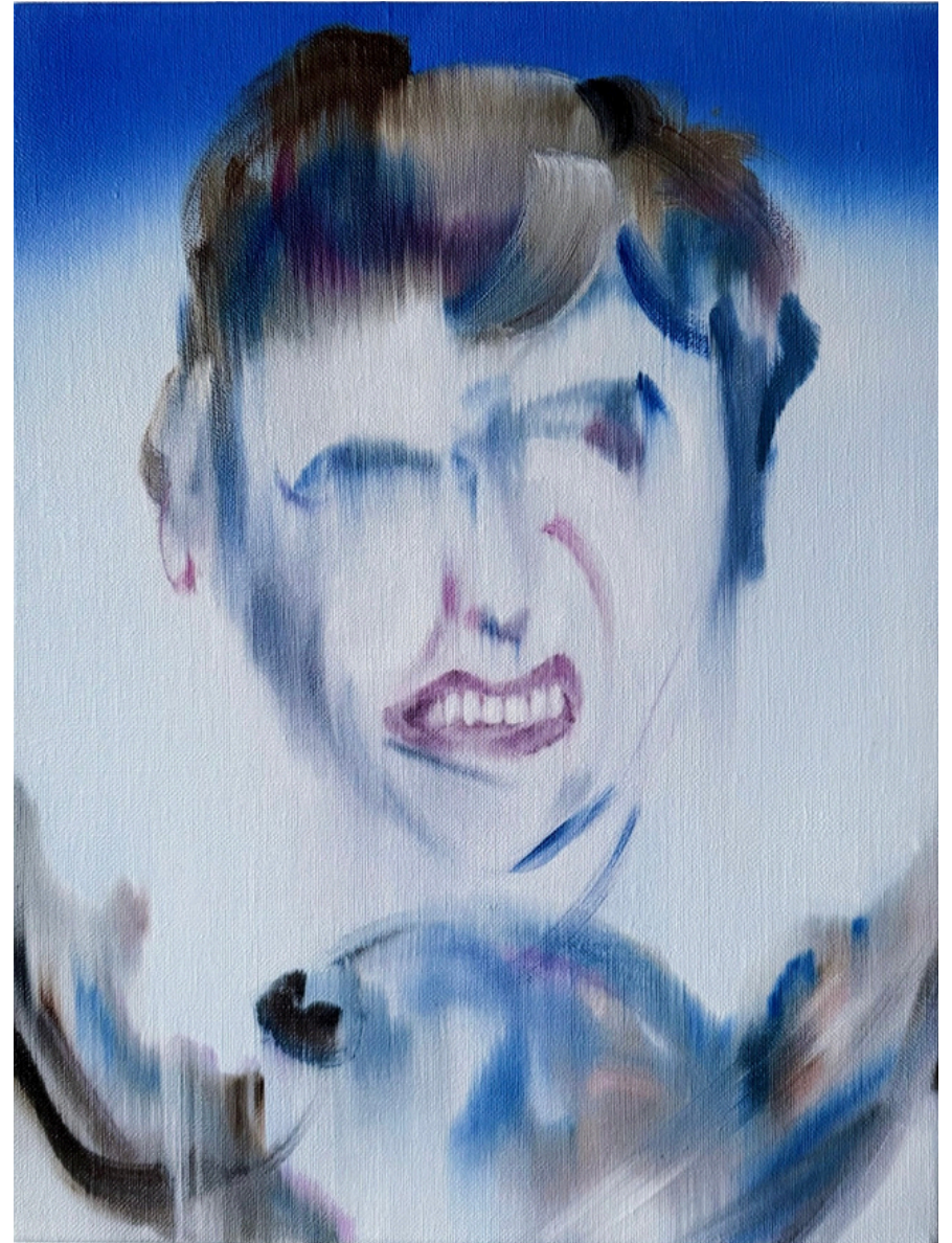
La promesse de l'aube (série) huile sur toile 30 x 40 cm, 2025