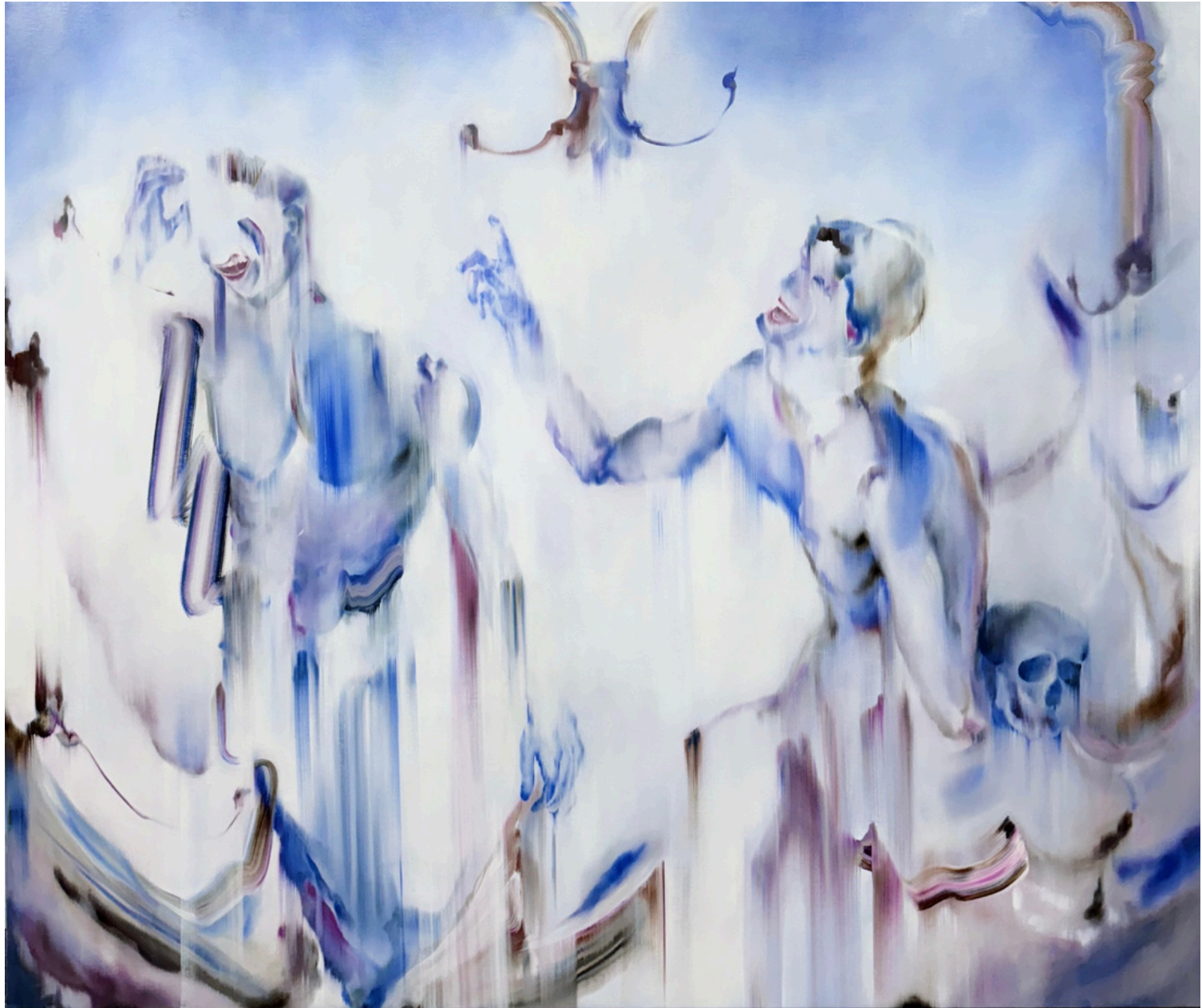
Mémoire d'une brûlure huile sur toile 190 x 160 cm, 2025