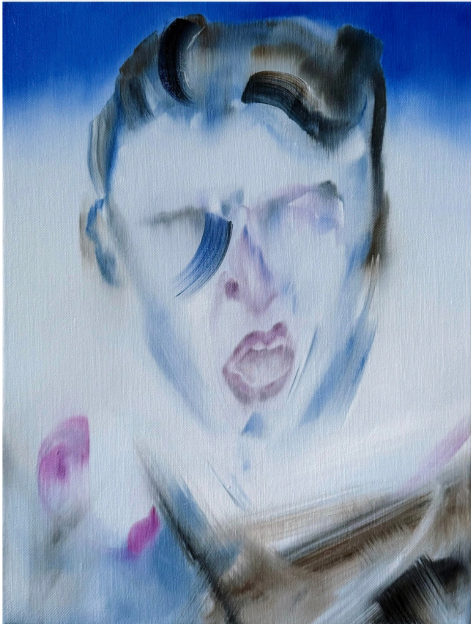
La promesse de l'aube (série) huile sur toile 30 x 40 cm, 2025