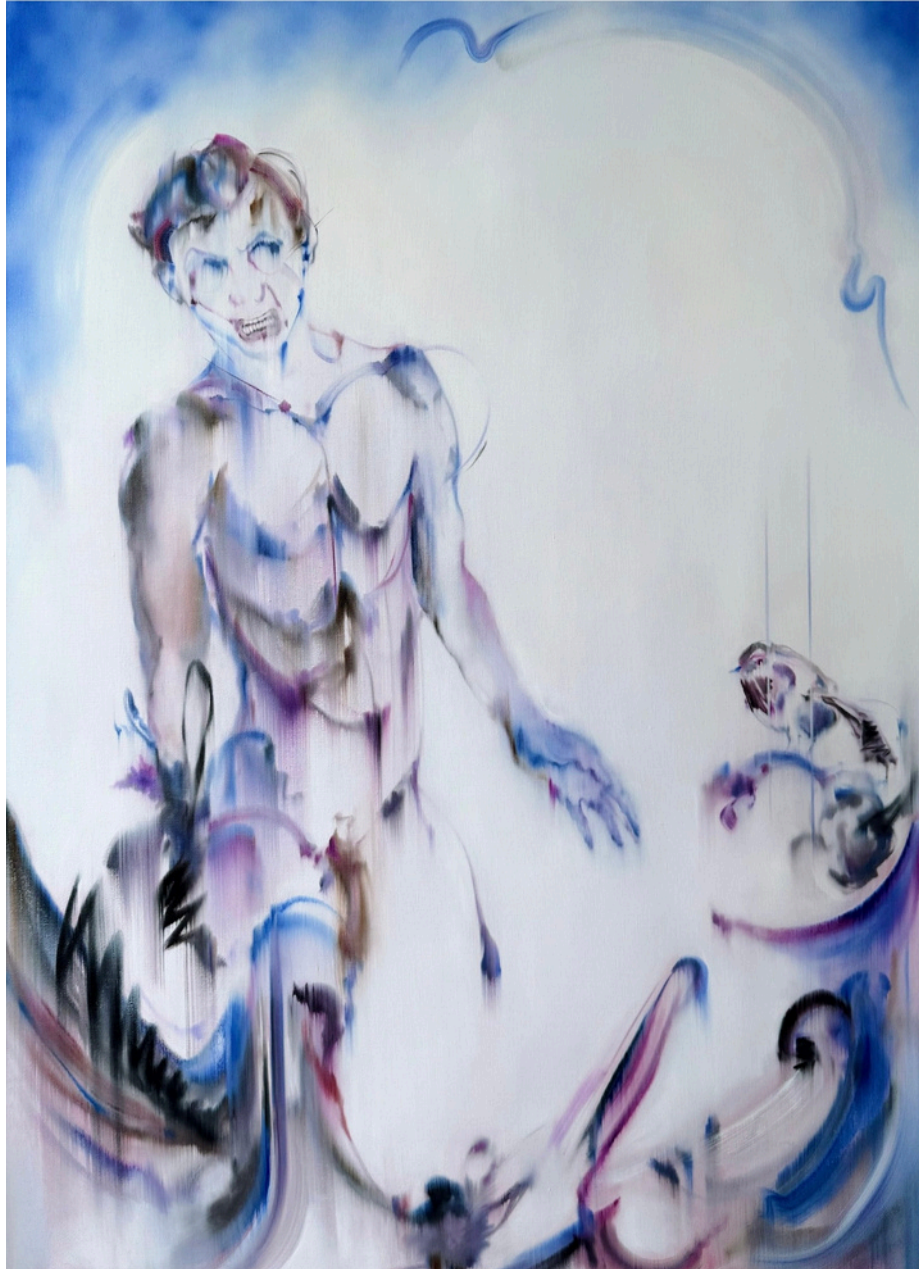
Brûlure huile sur toile 160 x 115 cm, 2026