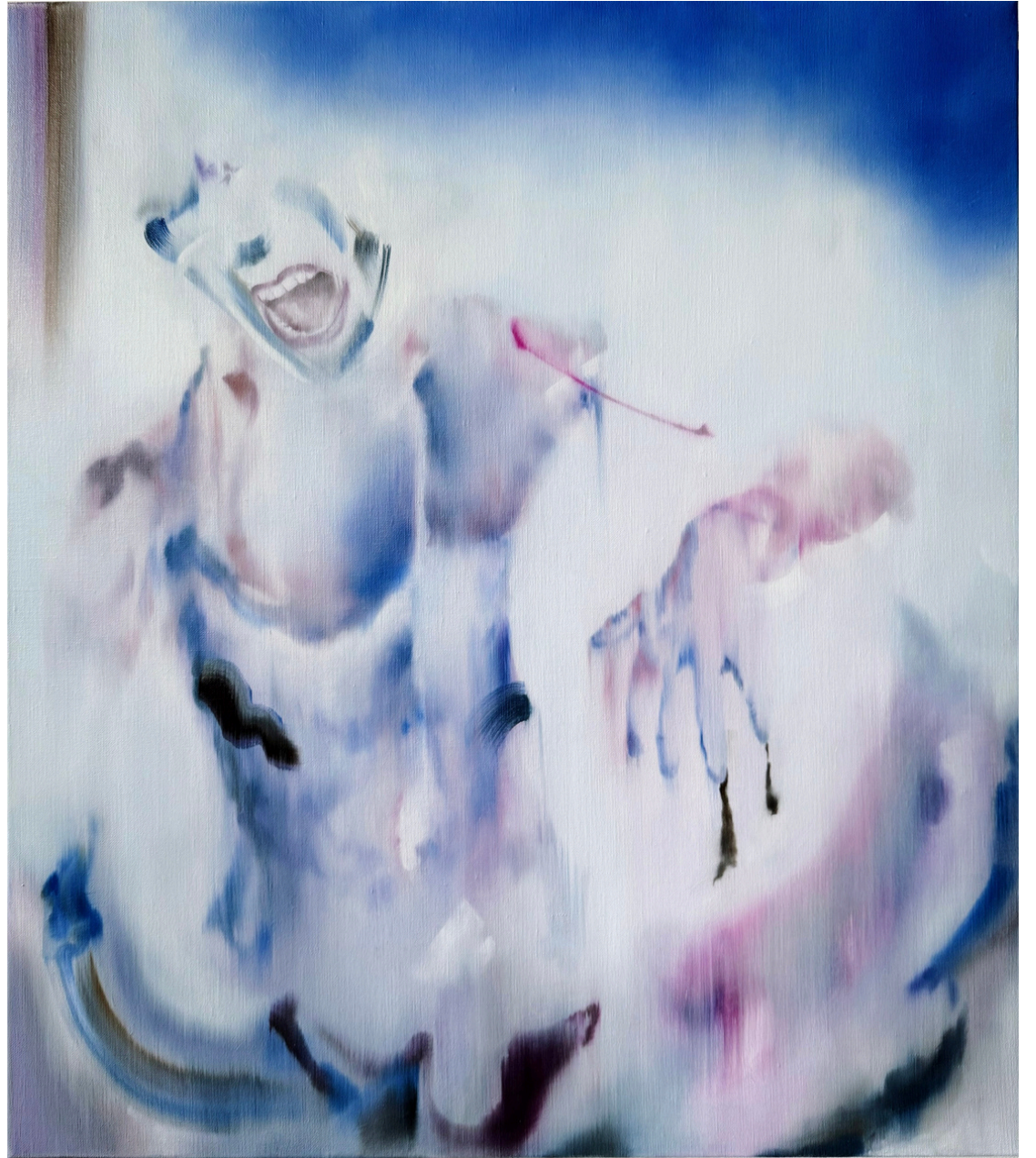
Destruction, chaos et failles II huile sur toile 70 x 80 cm, 2025