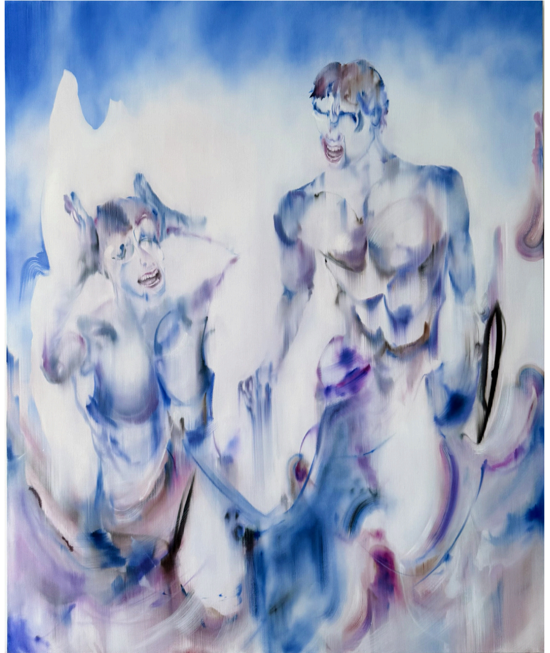
La mémoire dans la peau (série) huile sur toile 170 x 140 cm, 2026