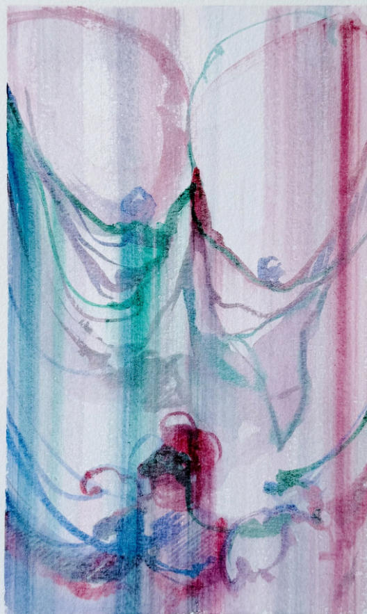
Génération 26 (série) Aquarelles sur papier 30 x 40 cm, 2026