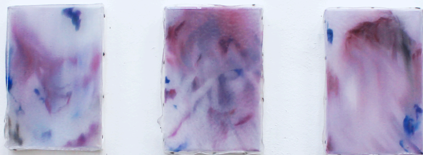
Deuxième naissance huile sur toile et résine epoxy 61 x 46 cm, 2025