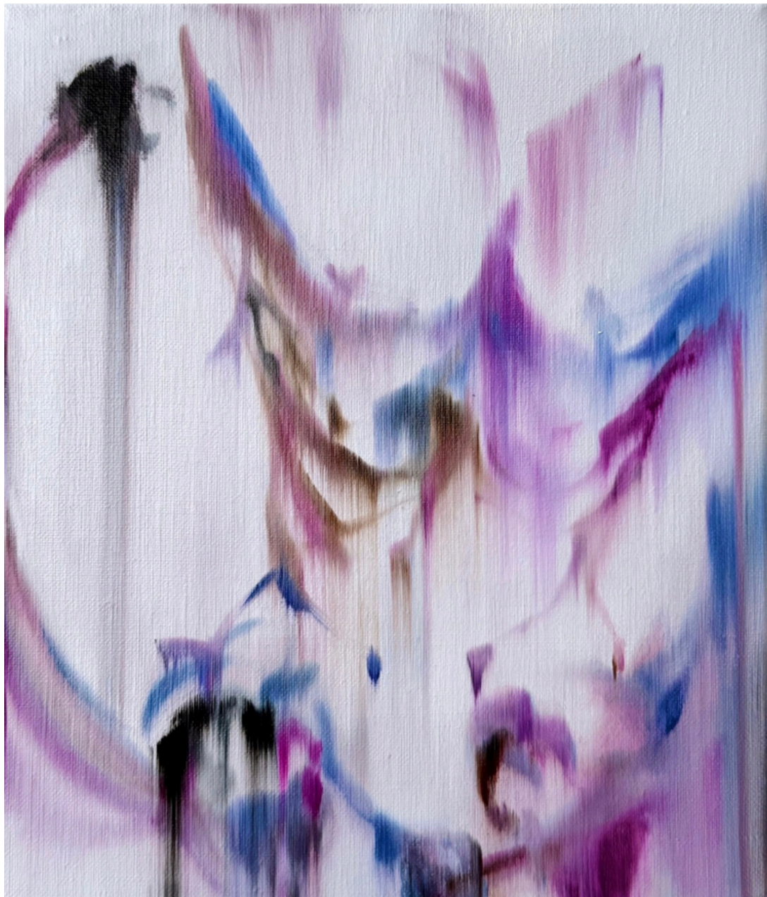
Sans titre huile sur toile 30 x 20 cm, 2026